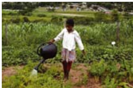
Anne Zarnitski/Getty Images