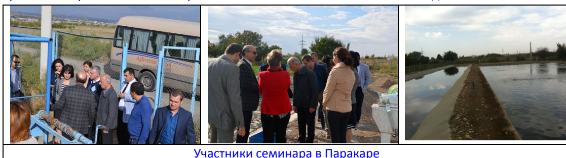
Участники семинара в Паракаре

Участники семинара посетили очистную станцию в селе Паракар и на месте ознакомились с работой станции, построенной с применением альтернативной технологии очистки сточных вод.