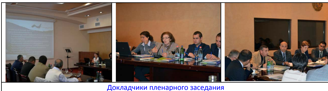
Докладчики пленарного заседания

Специалисты представили альтернативные технологии очистки городских сточных вод, а также опыт их применения в Армении.