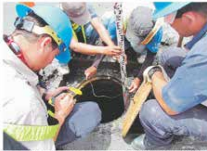
Como parte de la primera fase del proyecto, la ESPH y el consorcio GIA-Cacisa efectúan un levantamiento topográfico.

Se trata de la primera fase del proyecto de saneamiento am-