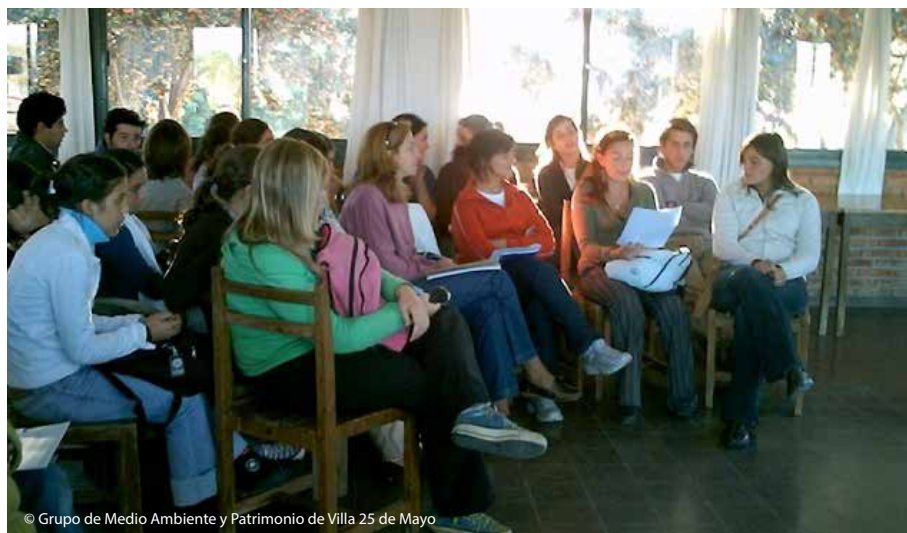
© Grupo de Medio Ambiente y Patrimonio de Villa 25 de Mayo

La determinación de estos/as vecinos/as de no quedarse de brazos cruzados los llevó a presentar un proyecto ante el Programa de Pequeñas Donaciones, perteneciente al Fondo Mundial para el Medio Ambiente (FMAM, más conocido por su sigla en inglés como GEF), que es implementado por el Programa de Naciones Unidas para el Desarrollo (PNUD). El proyecto fue aprobado y se desarrolló en el período de octubre de 2006 a agosto de 2009.