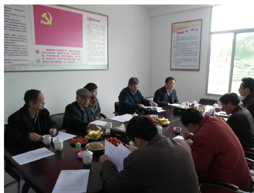
福建农民用水户协会现场调研与座谈

福建全省共组建农民用水户协会 2368 个，其中三明市已成立农民用水户协会 849 个，占行政村的 49%，农民用水协会管理水利工程 5557 处、灌溉面积 77.5 万亩，参与农户达 12.8 万户，涉及的农民达 50.8 万人。泰宁县以行政村为单位成立了 112 个用水户协会，占建制村的 100%，并依托用水户协会，建立了农田基础设施长效管护机制，农田水利设施管护工作取得了较好的成效。