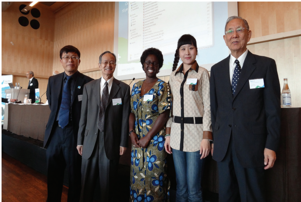
全球水伙伴（中国）代表团与全球水伙伴总部欧本主席合影

全球水伙伴（中国）代表团在咨询伙伴会议上积极参与会议各项议题的讨论，并提出意见或建议。代表团还就中国委员会 2011 年年底活动计划、2012 年工作计划和预算与全球水伙伴总部有关官员交换了意见。贾仰文教授代表中国委员会在咨询伙伴会议上做《保障粮食安全的水资源管理战略与实践》的报告。