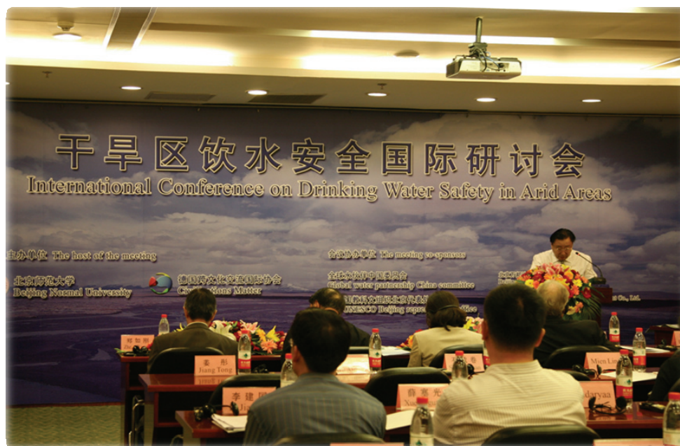
干旱区饮水安全国际研讨会现场

全球水伙伴中国委员会作为会议协办单位，曾多次与会议主办方北京师范大学进行沟通，积极协助落实会议具体筹备工作，联络并邀请了天津、河北、陕西、宁夏等各省水利厅的相关官员和专家参会。