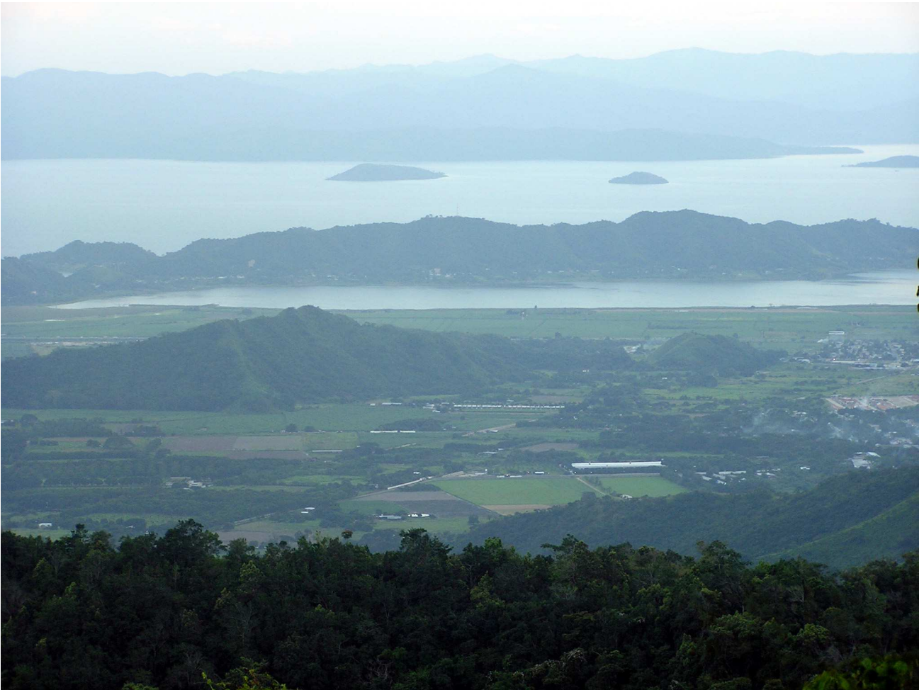
Vista del Lago de Valencia