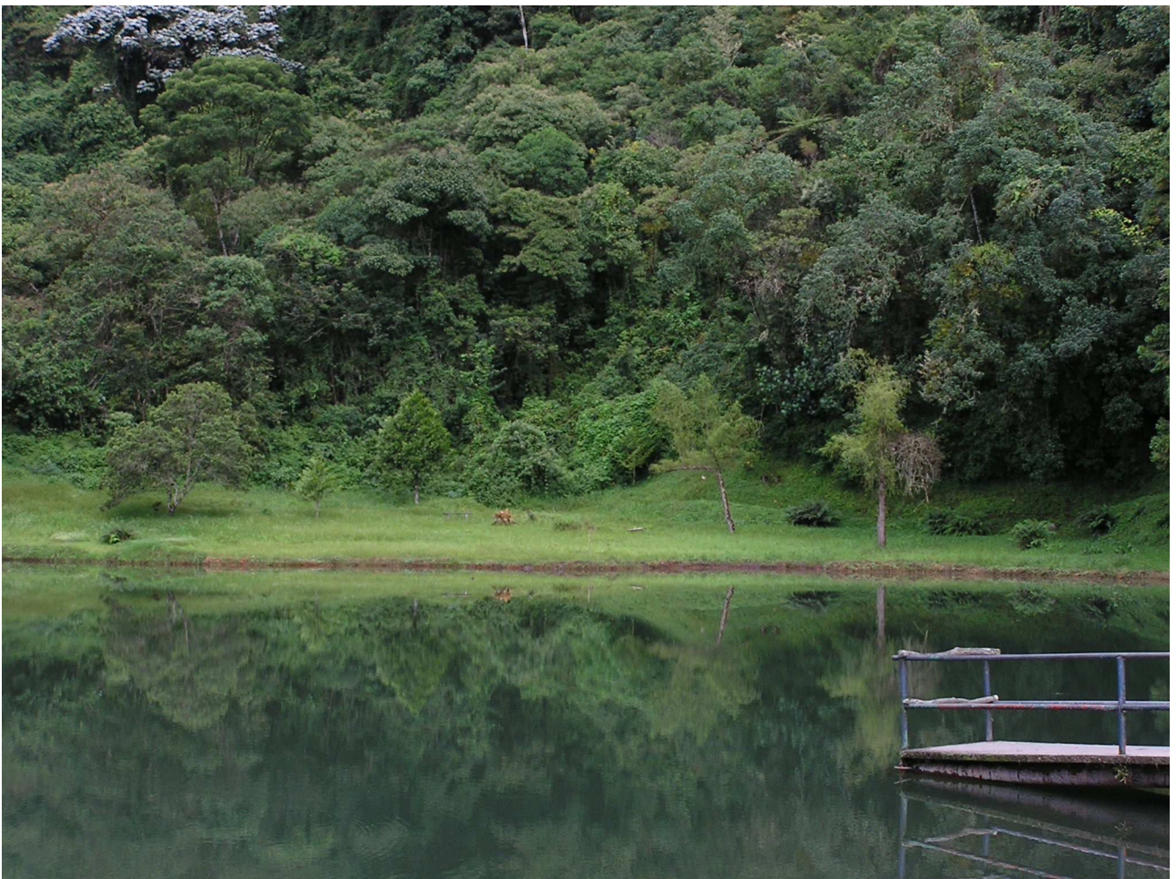
Laguna de Canaima

A pesar de ello, aún es posible desarrollar esta industria, que tiene que conjugar los criterios financieros, con la conservación del recurso bosque para poder satisfacer las necesidades de las generaciones futuras (Carrero y col., 2008).