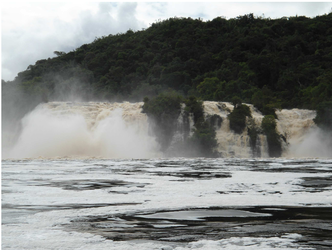
Saltos de Canaima