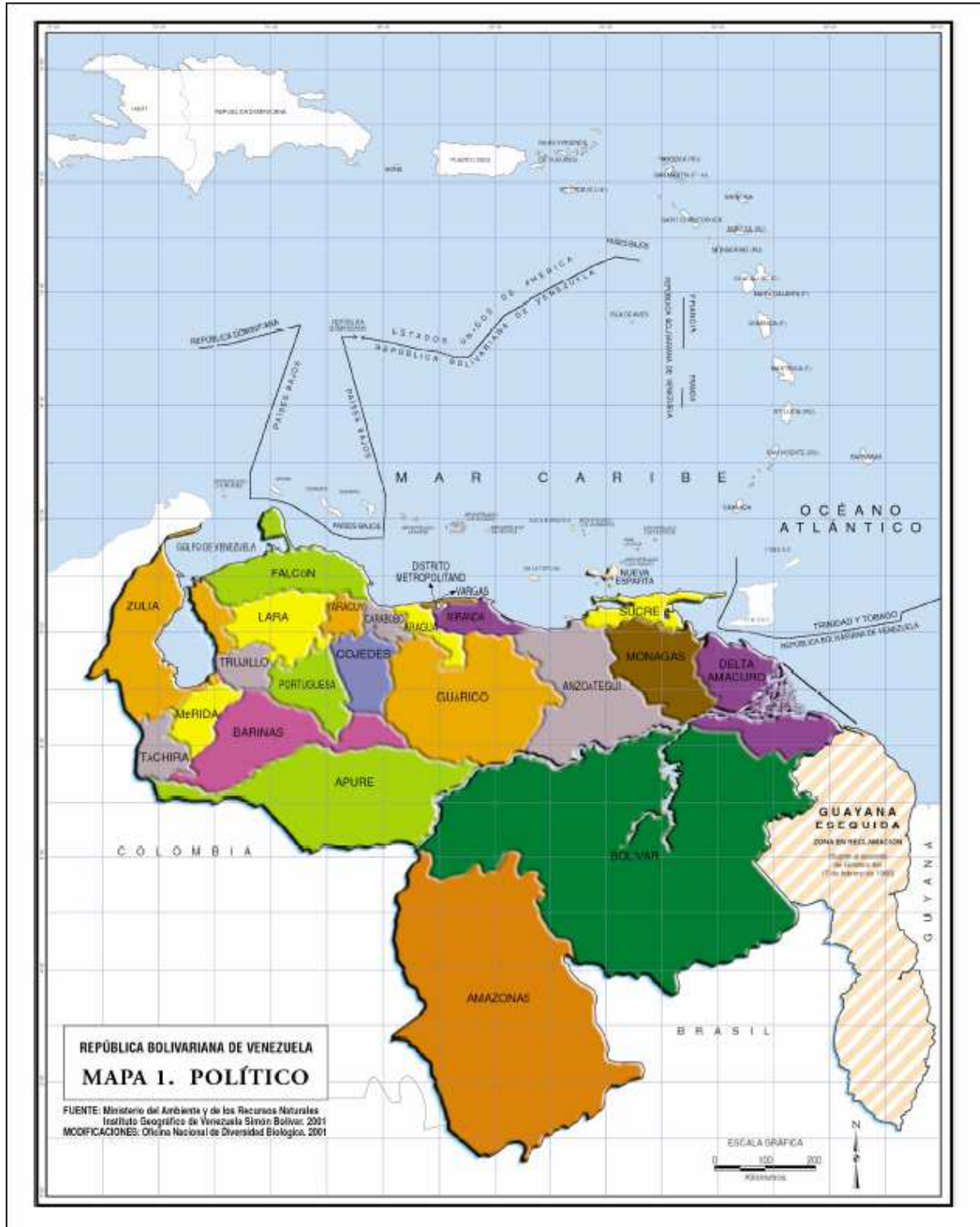
Figura 1. Ubicación geográfica relativa de Venezuela