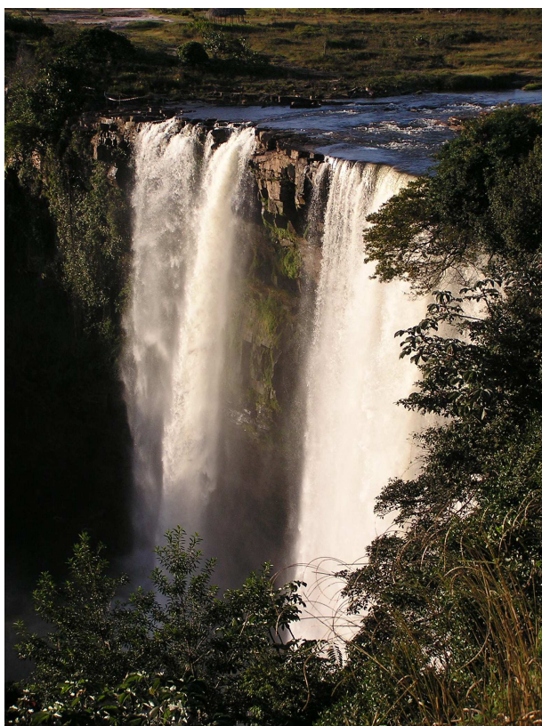
Salto Kama

Conforme se ha reseñado, desde los inicios del proceso de reestructuración del sector agua potable, se planteó como estrategia llevar a cabo la reversión del servicio a sus legítimos titulares que son los municipios. La primera etapa se cumplió mediante una desconcentración de funciones con un ámbito regional, avanzando luego hacia la descentralización en el ámbito municipal. Esto se traduce en un panorama actual donde en la mayoría del país el servicio es prestado por las Empresas Hidrológicas Regionales dependientes de HIDROVEN, y una menor parte es atendida por las Empresas Hidrológicas Municipales descentralizadas creadas hasta la fecha.