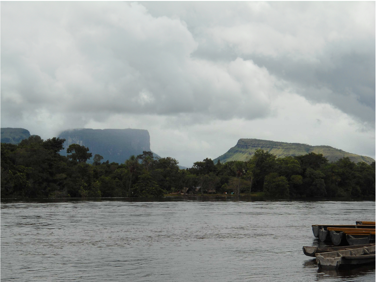
Río Carrao