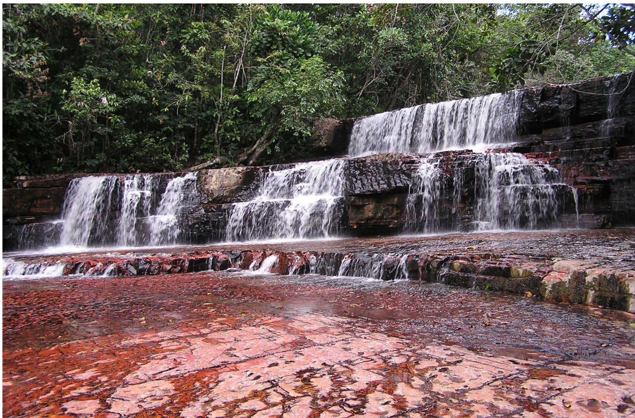
Quebrada de Jaspe