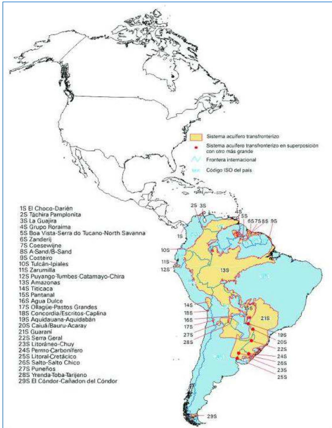
Figura 3. Sistemas Acuíferos Transfronterizos de Sudamérica