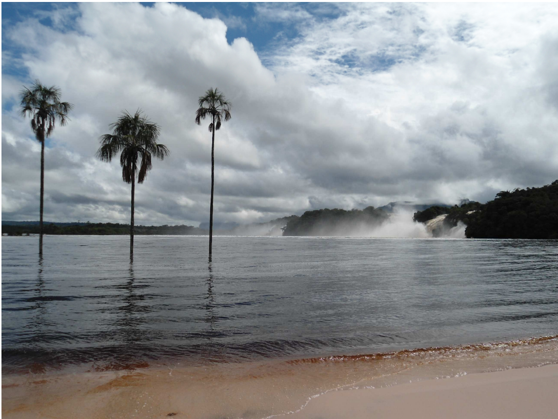
Laguna de Canaima

En Venezuela existe un alto número de vías con características de autopista, lo cual no tiene comparación en ninguno de los restantes países andinos, dicho sistema incluye la Autopista Regional del Centro, además de otros importantes sectores de la red vial 3 . Se cuenta con una infraestructura vial de 95.802 kilómetros, cifra que coloca al país entre los primeros de Latinoamérica, contando además con una infraestructura de puertos y aeropuertos, 6 de ellos internacionales. La red vial es más densa en la región centro norte del país, donde se concentra la población y las actividades económicas más importantes.