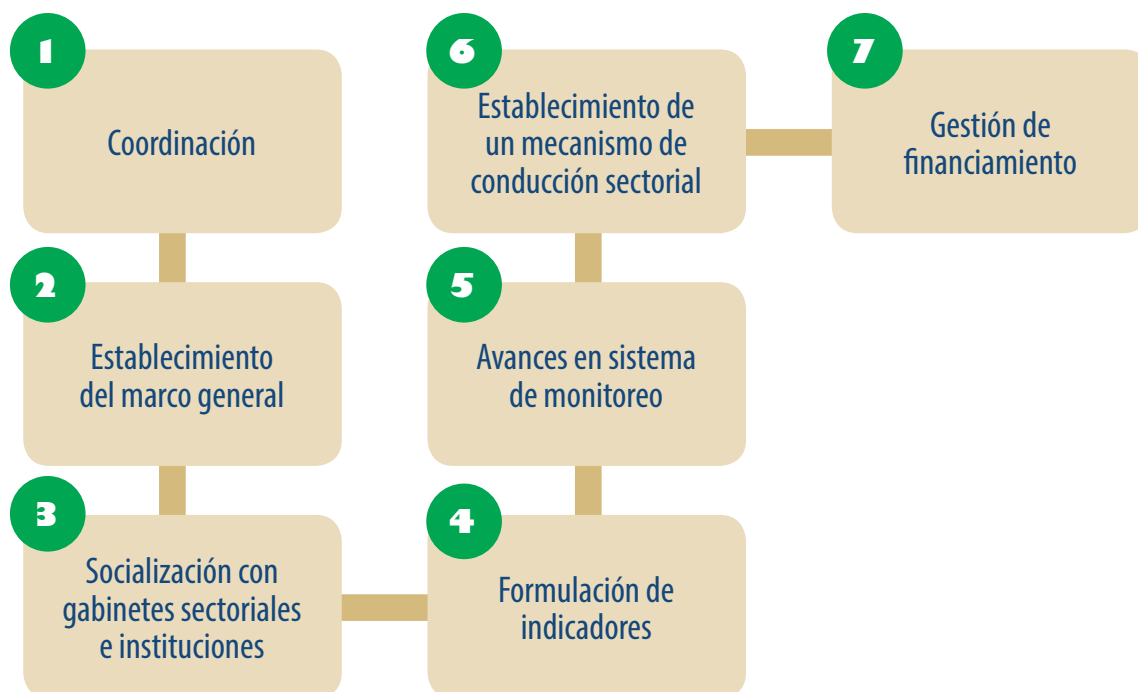
Gráfico 1: Proceso iniciativa ODS 6

distintos pasos seguidos así como mostrar lo dinámico del mismo, y también queda identificado que la gestión del financiamiento es continuo, con miras a lograr los apoyos de los distintos actores y sectores para la consecución del ODS 6 y sus metas.