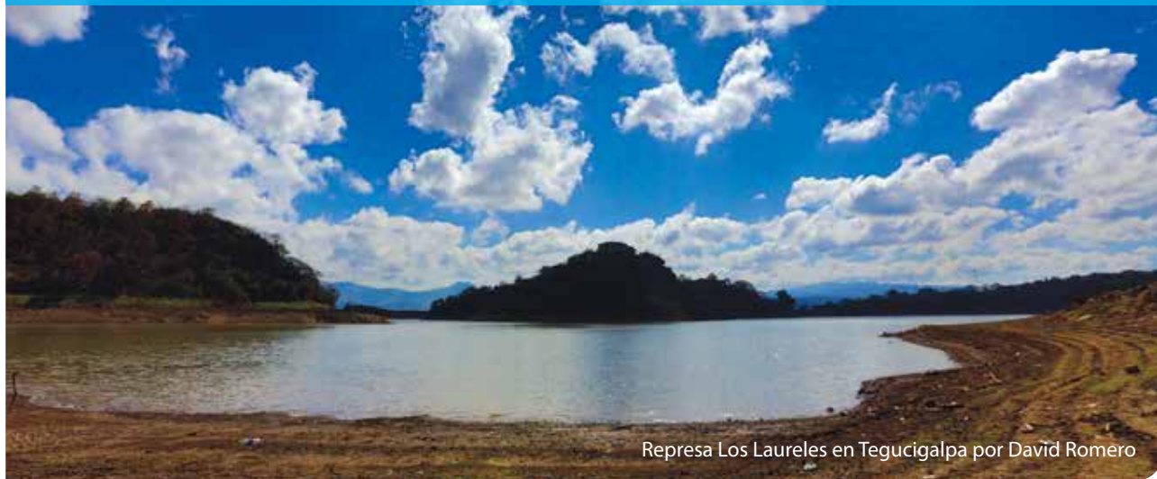
Represa Los Laureles en Tegucigalpa

El proceso de preparación para la implementación del Objetivo de Desarrollo Sostenible 6 “Agua Limpia y Saneamiento” se ha desarrollado como parte del compromiso de país para la implementación de la Agenda 2030. Este trabajo se le ha dado en llamar #IniciativaODS6.