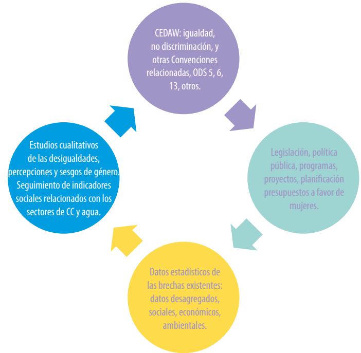
Gráfico 1. Elementos de análisis de género