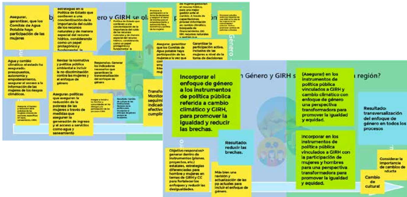
Imagen 3. Trabajo de grupo

A continuación, se presentan objetivos y resultados transformativos que fueron construidos por los dos grupos de trabajo durante el taller: