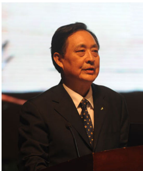
董哲仁常务副主席作特邀报告

10月20日，全球水伙伴中国委员会董哲仁常务副主席和王浩副主席应论坛邀请分别在大会上做题为《天人合一与黄河生态保护》和《黄河治理开发的方略思考及重大科学研究》主旨报告。两份报告角度新颖、观点鲜明，得到了国内外与会代表的一致好评。会议同时还邀请全球水伙伴秘书长阿妮娅女士担任大会报告的主持人。