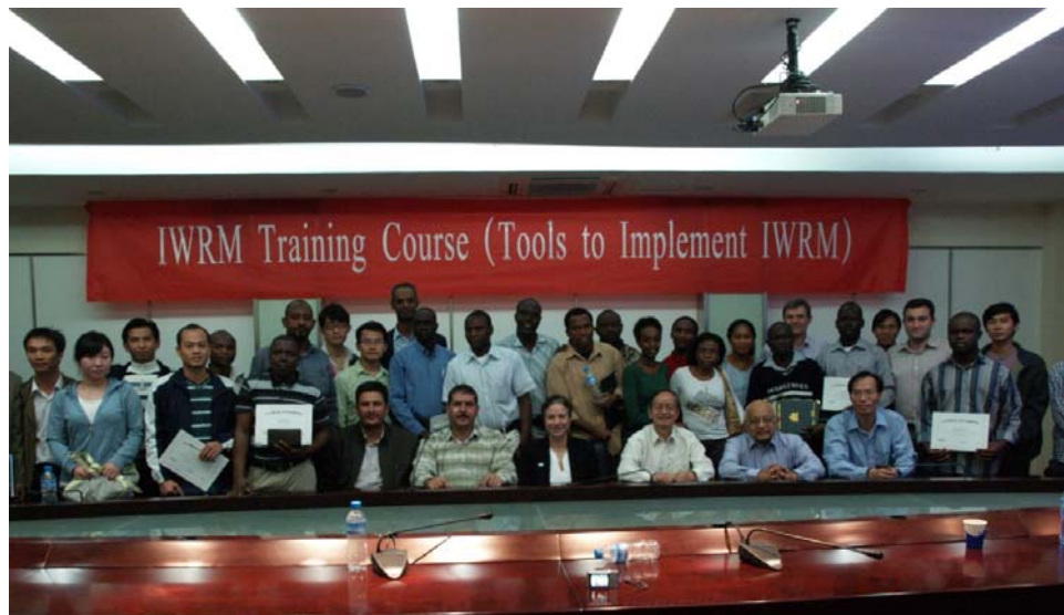
水资源综合管理与工具箱培训班

了全球水伙伴与全球水伙伴中国委员会的情况。培训班得到河海大学学员的一致好评，课上师生进行了充分的讨论与交流，对于水资源综合管理、工具箱的应用以及不同国家的水管理问题进行了探讨。