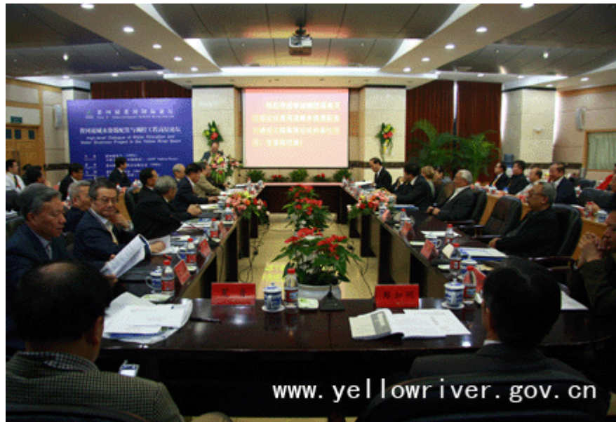
黄河流域水资源配置与调控工程高层论坛现场

科学院院士刘昌明、汪集旸，中国工程院院士陈志恺、曹楚生、陈厚群、茆智，全球水伙伴总部秘书长阿妮娅女士、高级顾问哈里德博士和全球水伙伴中国委员会秘书长郑如刚先生等出席论坛。