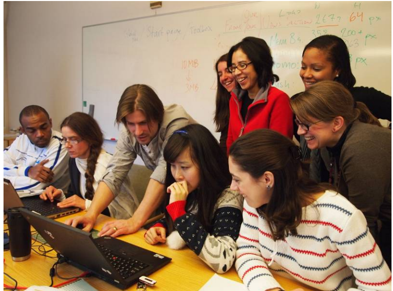
通讯员培训会议会场