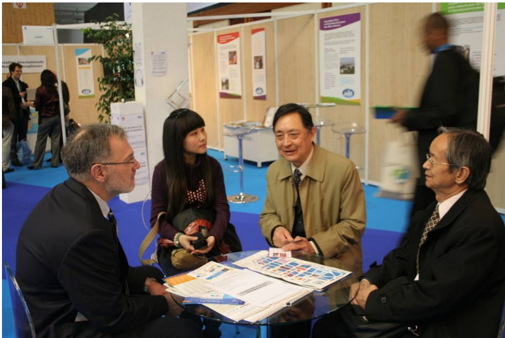
全球水伙伴(中国)代表团在世界水论坛期间与总部麦兹格先生交流

此次对话会上，中国-欧盟签署了《中国—欧洲水资源交流平台联合声明》，这是继中国-欧盟流域综合管理项目几近尾声后的衍生，《声明》将延续此次合作的成果，并进一步建立起系统规范的机制。此项联合声明的签署标志着双方长期合作平台的建立，有利于拓展中欧水资源合作的深度和广度，也可以进一步深化全面战略伙伴关系。