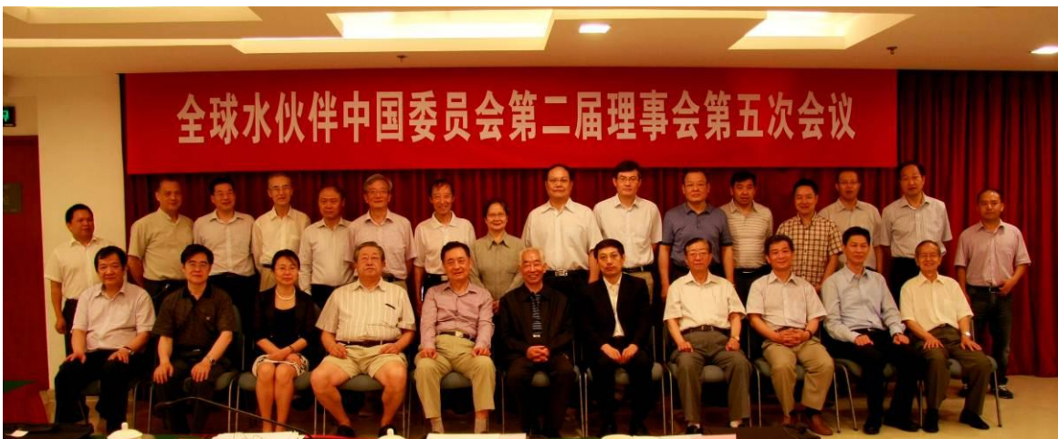
全球水伙伴中国委员会第二届理事成员

会议一致同意全球水伙伴中国委员会2013年工作报告，并对今后的工作提出了建设性的意见。会议认为，在水利部和全球水伙伴总部的指导与支持下，在省（流域）水伙伴和伙伴合作单位的支持下，