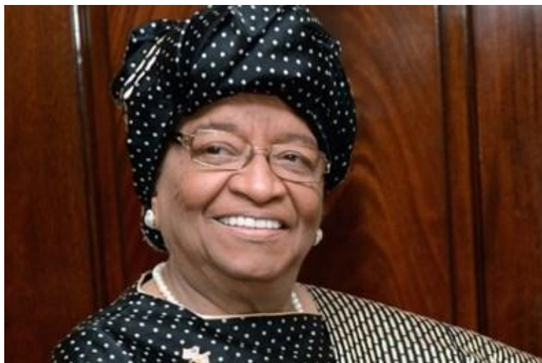
全球水伙伴新任庇护人埃伦·约翰逊·瑟利夫总统

瑟利夫总统是利比里亚共和国第24任总统，同时她也是非洲地区第一位民选女性国家元首。2011年，她与其他两位女候选人因“使用