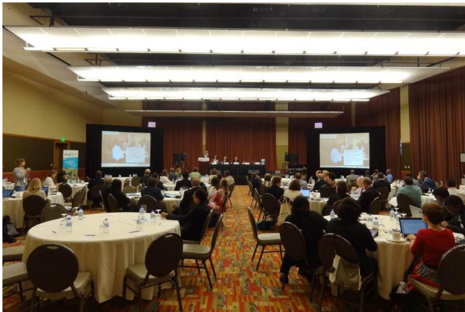
2014 年度伙伴咨询会议现场