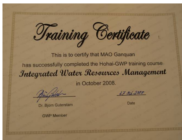
水资源综合管理培训证书

水资源综合管理理念及工具箱运用受到了参加培训人员的积极响应。培训班后，全球水伙伴中国委员会与河海大学商议将在今后定期合作举办年度培训班。河海大学计划将积累的科学研究成果编写为水资源综合管理工具箱案例，纳入全球水伙伴 IWRM 工具箱，介绍和推广中国水资源综合管理经验。