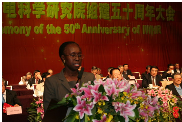
欧本女士在中国水科院院庆50周年上致辞

开。全球水伙伴主席欧本女士、全球水伙伴中国委员会主席汪恕诚、常务副主席董哲仁、副主席王浩出席了开幕式。欧本女士在开幕式上就全球水伙伴支持水资源综合管理发表了主旨演讲。