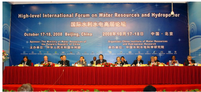
国际水利水电高级论坛会场

10月17日，由水利部主办，中国水利水电科学研究院承办，全球水伙伴中国委员会协办的“国际水利水电高层论坛”在北京隆重召