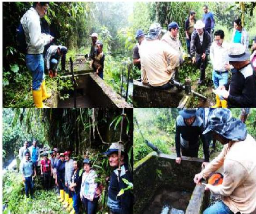
Elaboración: Equipo Consultor