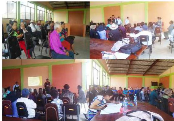
Elaboración: Equipo Consultor