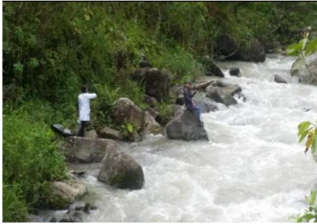
Ilustración 51. Tercer punto de monitoreo.